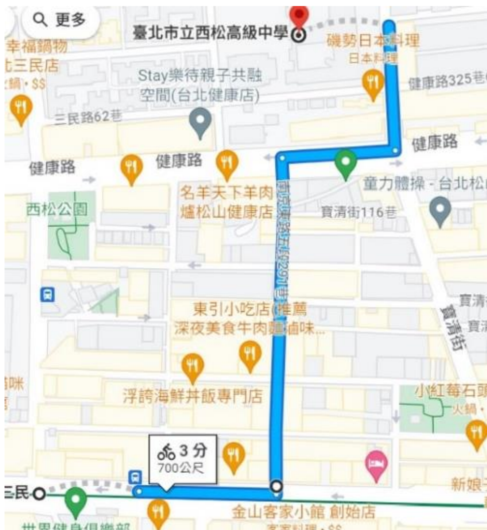
(南京三民捷運站4號出口 > 本校 路線指引圖)

二、捷運搭乘資訊：松山新店線【南京三民站】，建議4號出口，步行約10分鐘即可抵達本校，出站可轉騎U-Bike，約3~4分鐘至校門口。