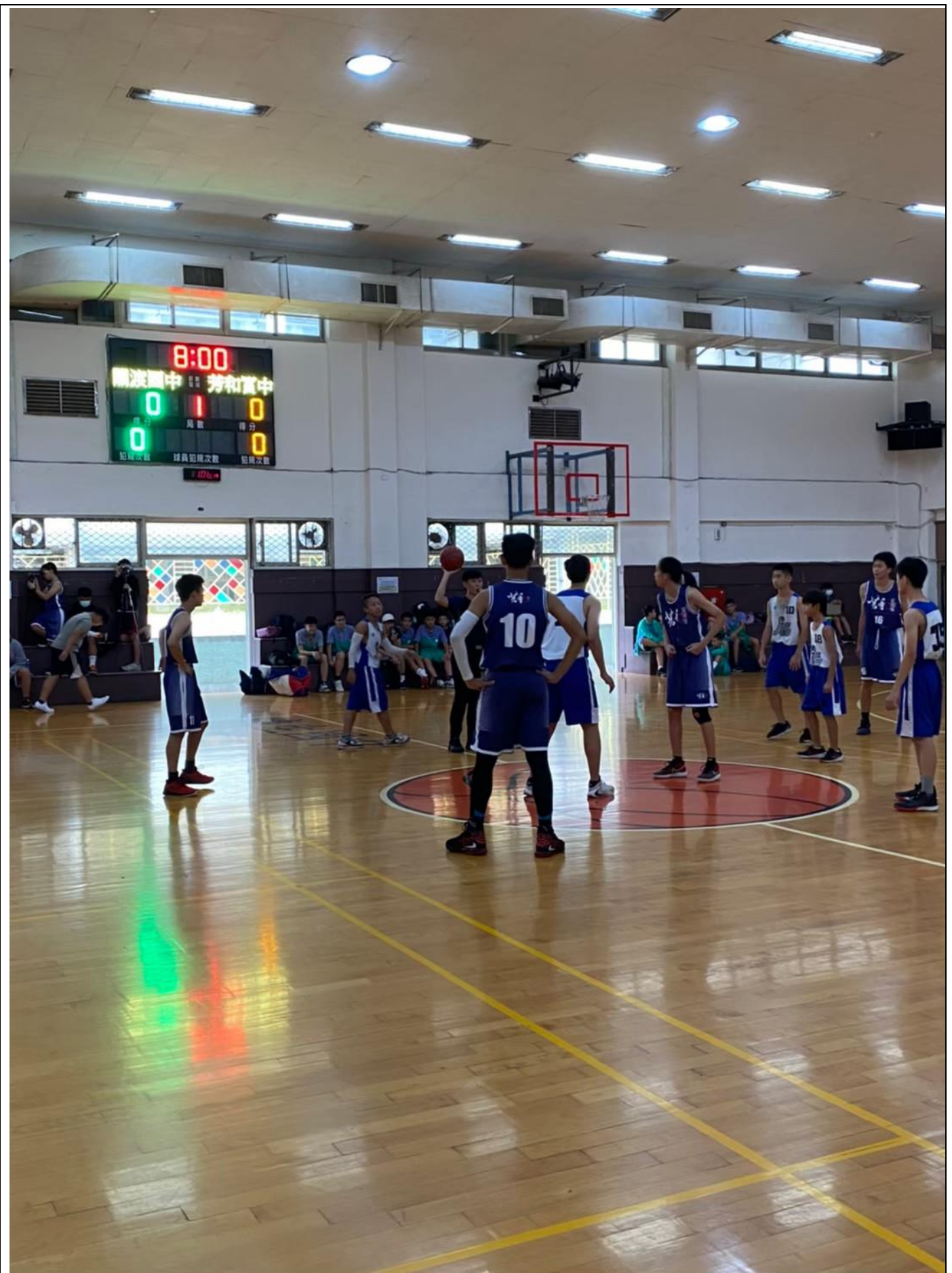
臺北市 109 學年度教育盃中等學校籃球錦標賽