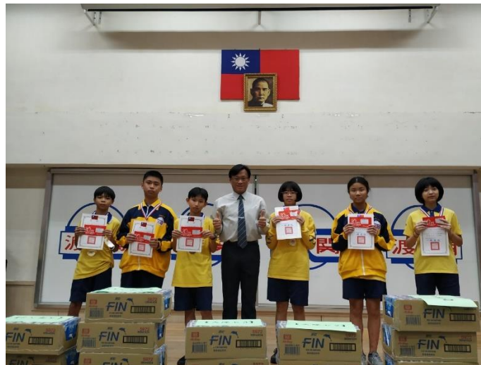
閉幕典禮頒發獎項