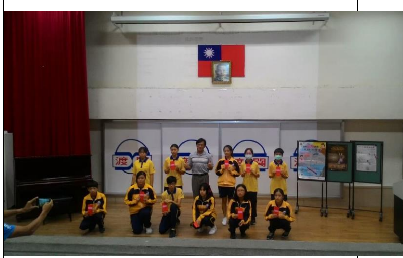
頒發北市優秀學生獎學金