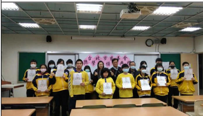
台北市慈善會助學金頒發