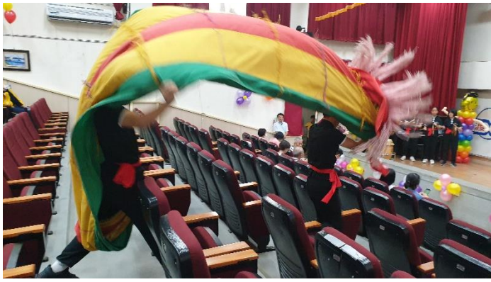
龍兄虎弟迎賓開場