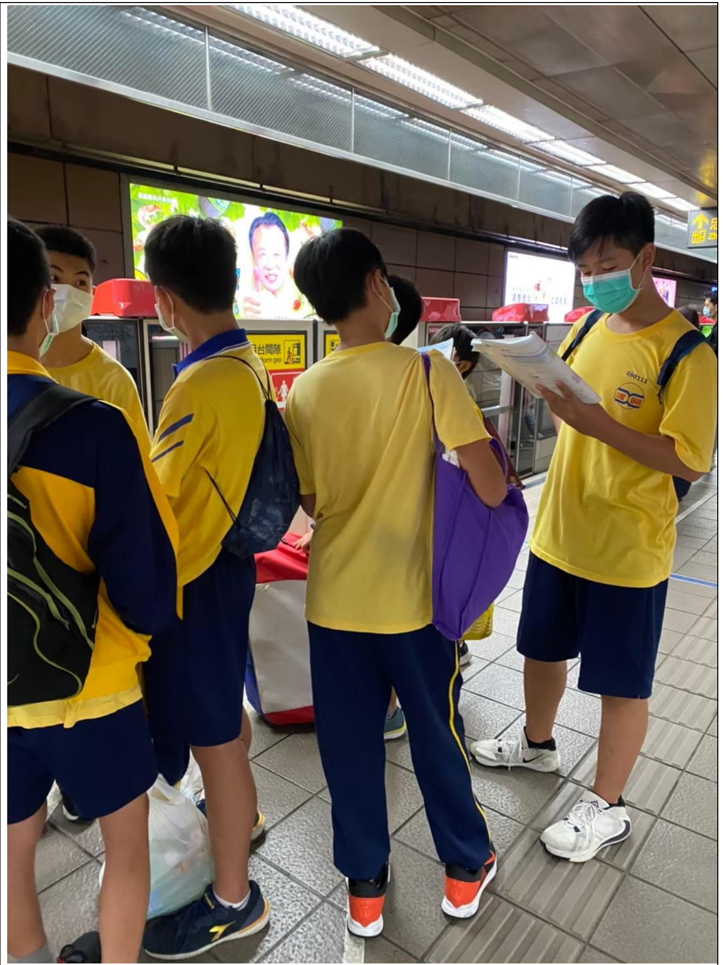
臺北市 109 學年度教育盃中等學校籃球錦標賽