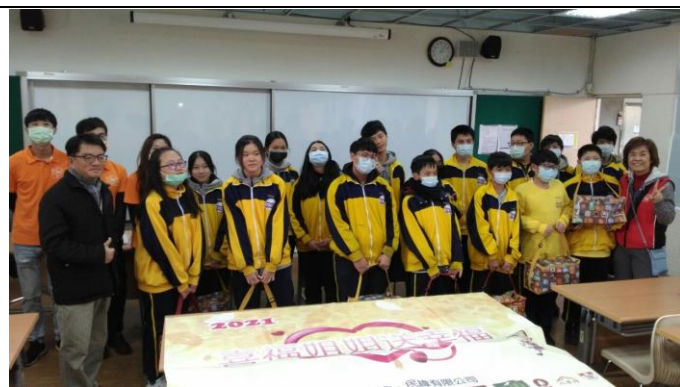
喜福會年菜致贈活動