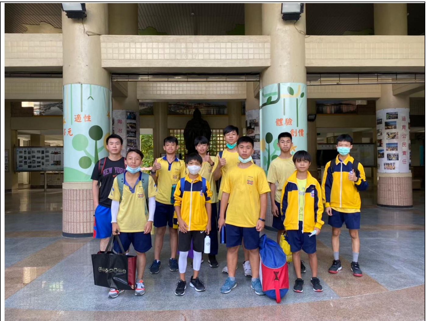
臺北市 109 學年度教育盃中等學校籃球錦標賽