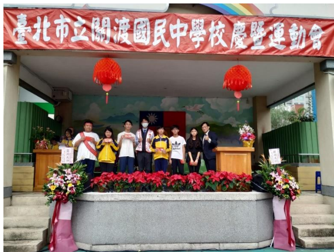
校長與家長會長頒發優生獎學金