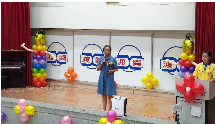
家長會長致詞勉勵