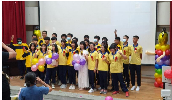
畢業班級與導師合照