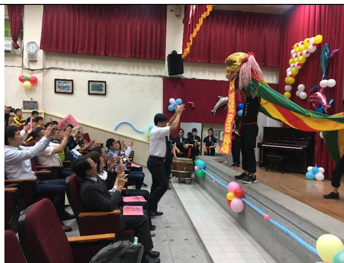
校慶慶祝大會開幕