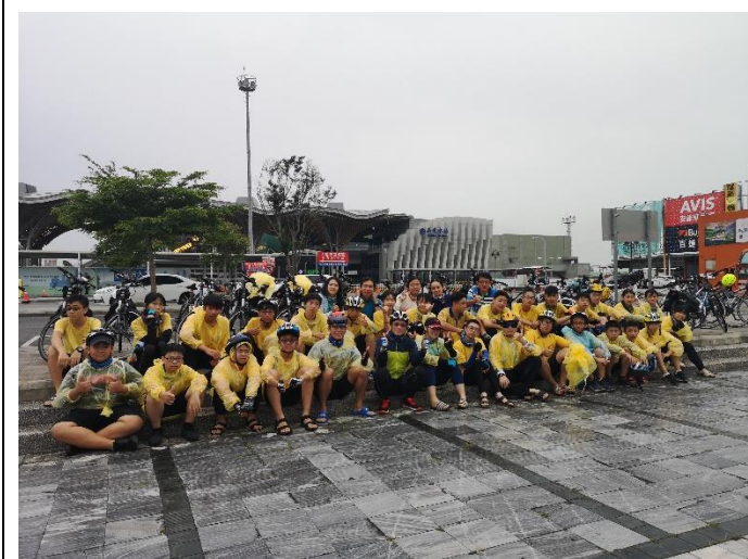
花東 200K 單車行