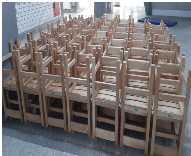
購買八年級課桌椅