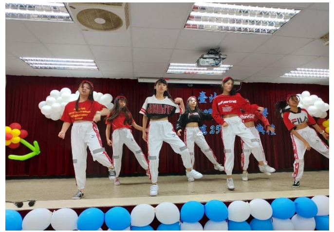
九年級畢業生表演