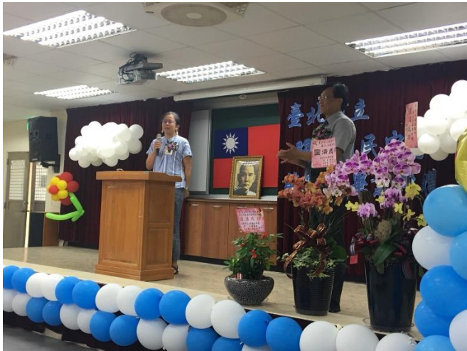
家長會長致詞勉勵