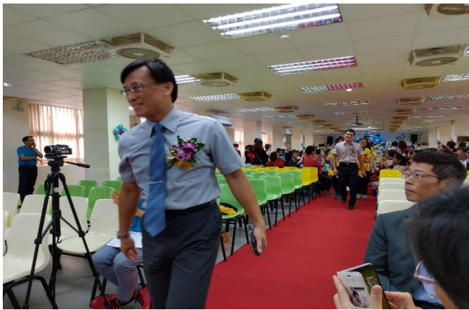
校長引領九年級畢業生進場