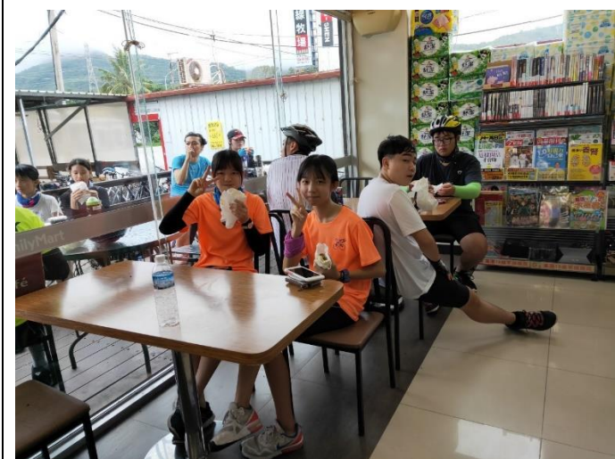
花東 200K 單車行