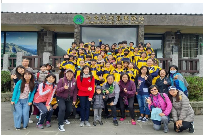
冷擎步道漫步大合照