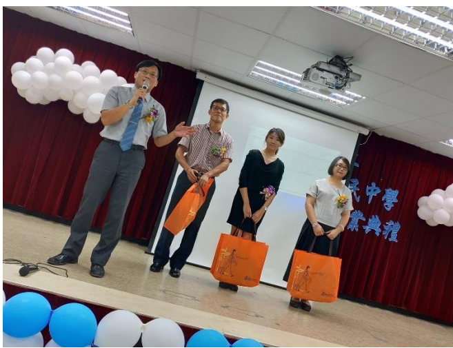
畢業班導師接受校長禮品