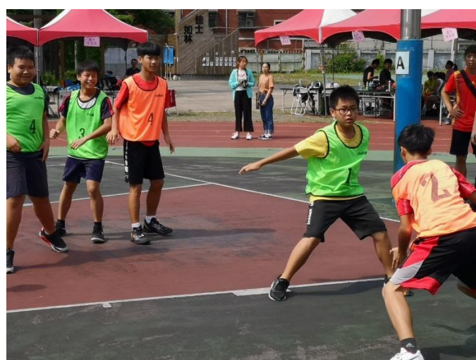
108 臺北市士林區青少年 3 對 3 籃球比賽