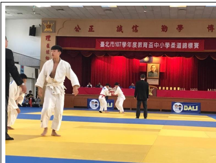
107 學年度教育盃柔道錦標賽