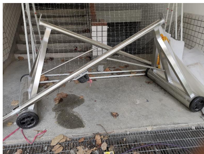
排球柱 1 件