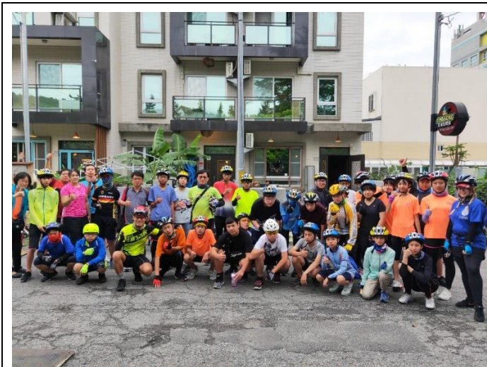
花東 200K 單車行