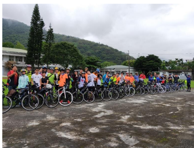
花東 200K 單車行