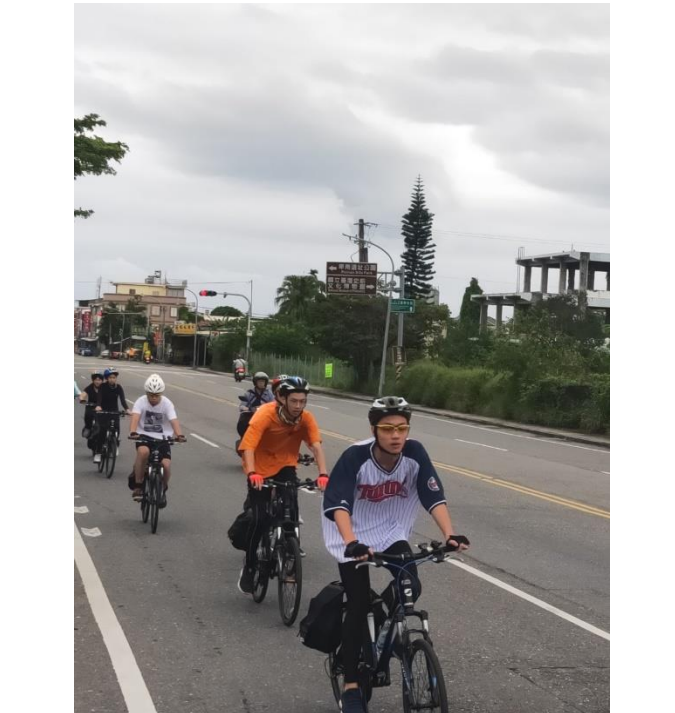
花東 200K 單車行