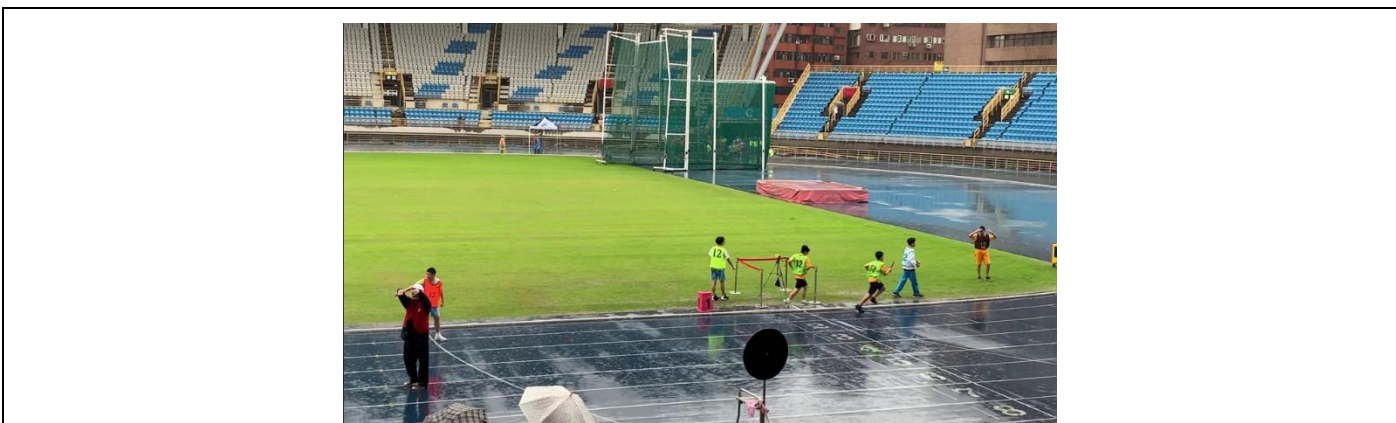
107 學年度教育盃柔道錦標賽