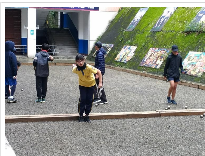
107 學年度教育盃法式滾球錦標賽賽前練習