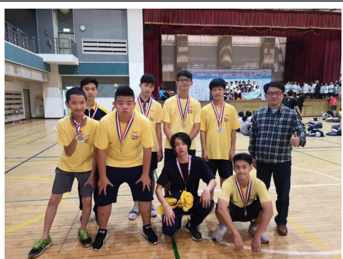
臺北市第 15 屆市長盃校際游泳大隊接力賽國中男子組第二名、國中女子組第二名