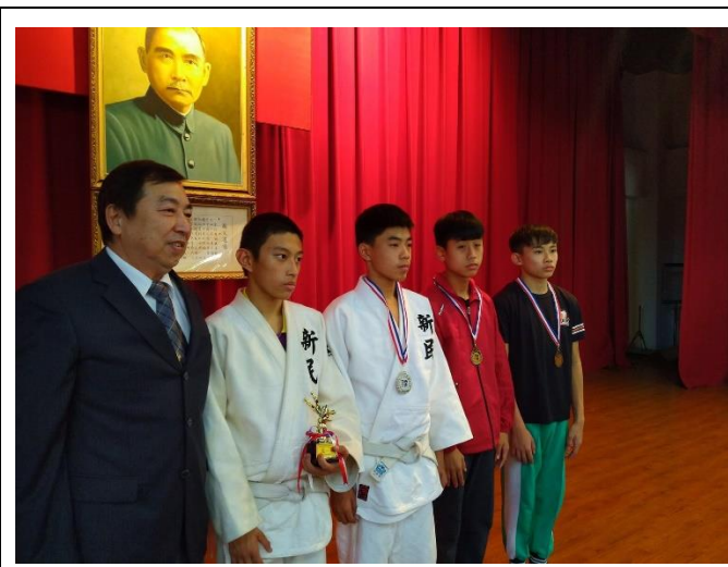
107 學年度教育盃柔道錦標賽頒獎