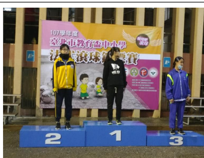
107 學年度教育盃法式滾球錦標賽個人賽第二名