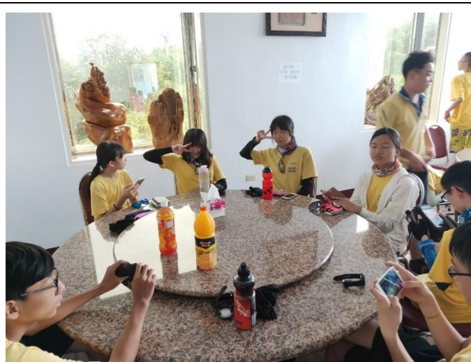
花東 200K 單車行