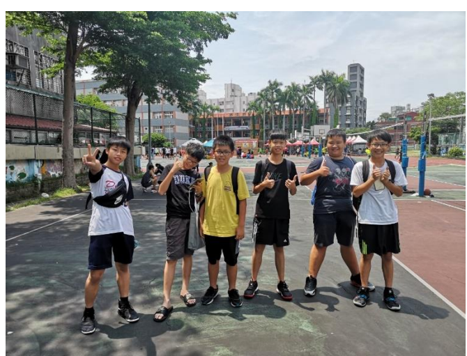
108 臺北市士林區青少年 3 對 3 籃球比賽